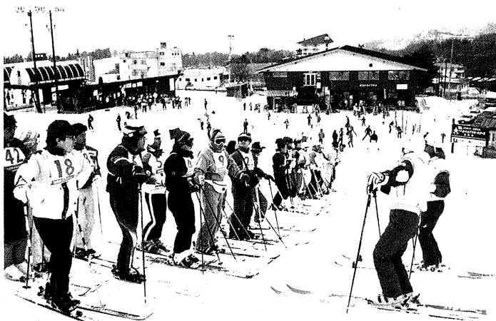
▲ゲレンデに並び指導を受ける参加者の皆さん