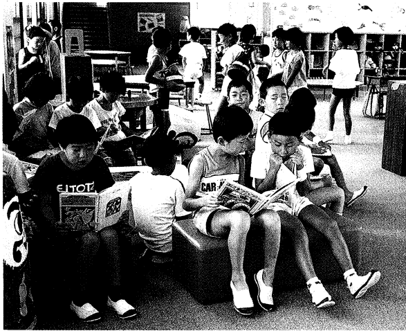
▲休み時間のひととき、思い思いに過ごす子どもたち（磐梯町立磐梯第一小学校）