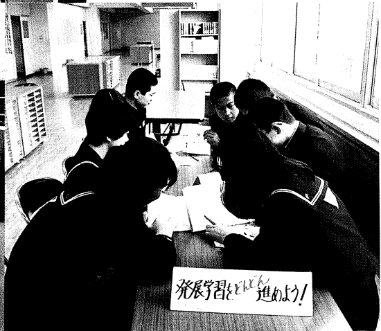
▲広々としたスペースで、のびのびとした中でも真剣に学習に取り組む（郡山市立富田中学校）

幅広の廊下状のものや、吹き抜けもある多目的ホールなど、形態も、その利用のしかたも学校によって異なりますが、どの学校でも新しい環境を活用しようとする先生方の工夫が生かされて、オープンスペースは子どもたちの明るい表情であふれています。