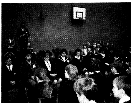
英国ロゼット校での歓迎式典のよう

さらに、六十三年五月には市当局の配慮により、本校生徒の代表十人がロゼット校を訪問した。英国では、ハ