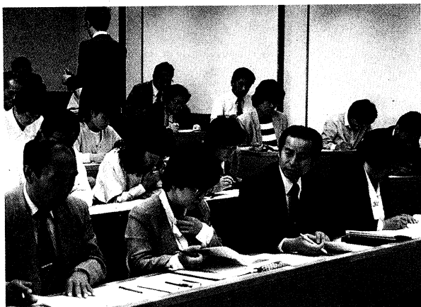
「障害児の行動理解」の演習風景

この研修会に参加した先生方(新採用教員は除く)は、障害児の行動理解や学習指導などについて研修し、養護教育への決意を新たにしていました。