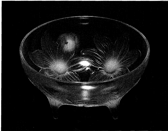
▲ゆり (鉢) 1924年