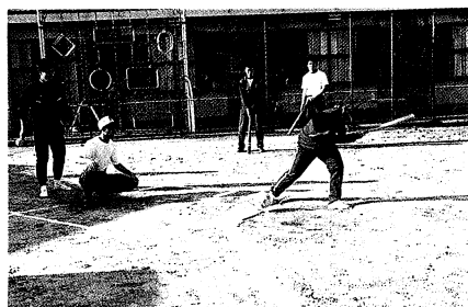
▲熱の入るバッティング練習〈野球部〉