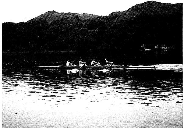
▲萩野漕艇場での乗艇練習

日ごろの活動は放課後、萩野漕艇場で行う乗艇練習が中心になります。漕艇場のある磐越西線荻野駅までは二駅離れていて列車の発着時刻の制約を受けるので駅から漕艇場まで走って時間を節約し、約二時間の練習をします。貴重な時間を生かして集中的に行うために技術の習得も早く、効率的な練習になっています。