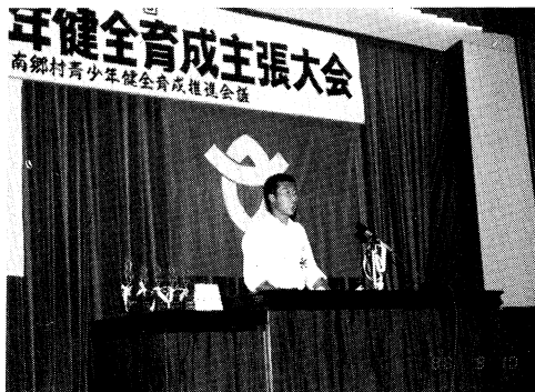
村の将来は主張から

特に、「社会の成員としての使命と、役割を自覚し、心身ともに健康にして、創造性豊かな青少年の育成」を目標として掲げ、各関係機関、団体との連携を図りながら地域ぐるみで取り組んでいる。