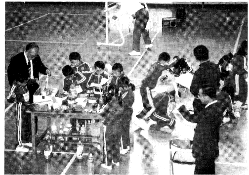
広い空間でのびのび授業

当南会津管内における若い教員の占める割合は大きい。二十代が管内全教員数の三十六パーセント、三十代が三十三パーセント、四十代まで含めると約八十五パーセントに達する。このような若い教員層の中にあつて、特に、二十代の教員は、他管内では得がたい貴重な体験をすることができている。 第一に、小規模・小人数校が多いので、児童生徒一人一人に接する時間を十分に取ることができる。第二に、塾などが少ないので、学校教育本来の機能を発揮できる。第三に、教員数も少ないことから、若くして主任クラスの業務を分担するなど、研修を受ける機会も多い。第四に、他管内出身者が多いことから、多様な指導方法や人生観を学ぶことができる。南会津のこのよ