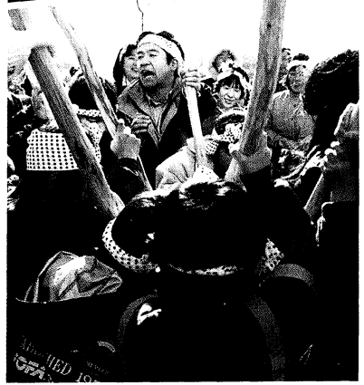
主催事業、親子雪のつどい（もちつき）