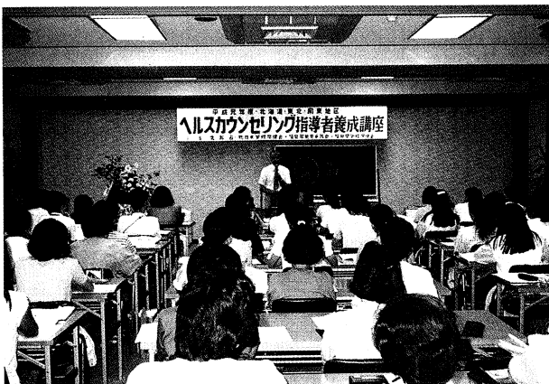
講話に真剣に耳を傾ける受講者の皆さん

一都一道十三県から百十名が参加し、ヘルスカウンセリングの知識や、技術を身につけるため、熱心に研修しました。