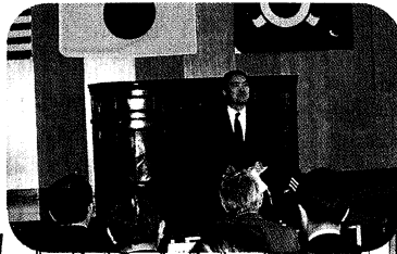
◀ 団員を激励する 大内県教育長