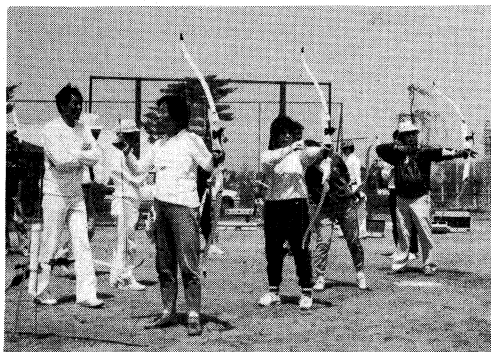
未普及競技の普及は大きな課題(ライフル射撃)中