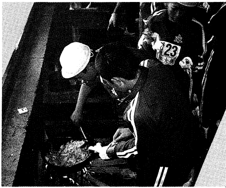
▲自分たちで作る料理は格別

○利用できる団体 二十四時間以上滞在し、自主的なプログラムをもち、責任者が明確で五名以上の団体。 ▽申込みの方法▲ 事前に予定日に入所が可能かどうかを確認し、電話または、文書によって申込み。なお細部については、直接当施設にお問い合わせ下さい。