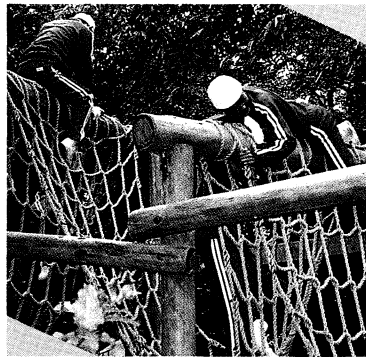
▲フィールド・アスレチックに挑戦

会津少年自然の家は会津盆地の北西部に位置し、古くから越後街道としてにぎわった会津坂下町塔寺より北へ約八百メートル、標高二百二十二メートルの丘陵地帯にあります。東に磐梯山北に飯豊山を仰ぎ、広大な会津盆地を見おろすことができ、四季おりおりの変化に富んだ恵まれた自然環境の中にあります。