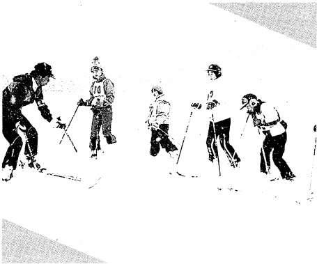
▲早く上手に滑れるように(スキー教室)