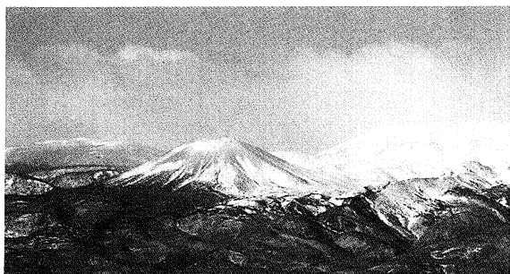
新雪のかがやきもまぶしく、厳しく、そして気高くそびえる福島の山々。(左：吾妻山、下：安達太良山と磐梯山)