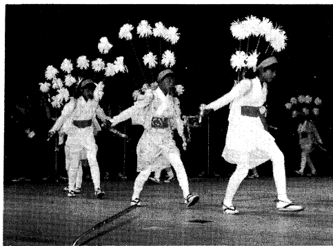
郷土の民俗芸能を紹介（玉川村平鍬踊）

北海道東北地方の民俗芸能への認識を深め、その保護・伝承についての正しい理解と協力を得ることを目的とする北海道・東北ブロック民俗芸能大会が九月三日に県文化センターで開かれた。本県からは田島町太々神楽、玉川村の平鍬踊、福島一小児童によるわらべ歌等が披露され、郷土の民俗芸能への関心を高める有意義な催しとなった。