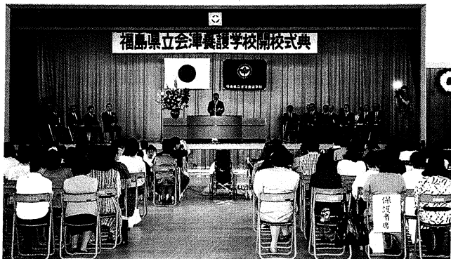
多数の関係者の出席のもと、盛大に行われた開校式