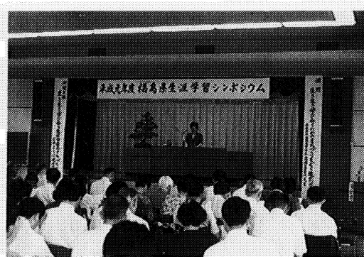
生涯学習シンポジウム(湯川村)での実践発表

市町村における「生涯学習をすすめるまちづくり」の学習環境の諸条件の整備促進を図ることをねらいとして開催します。