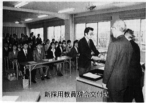
新採用教員辞令交付式