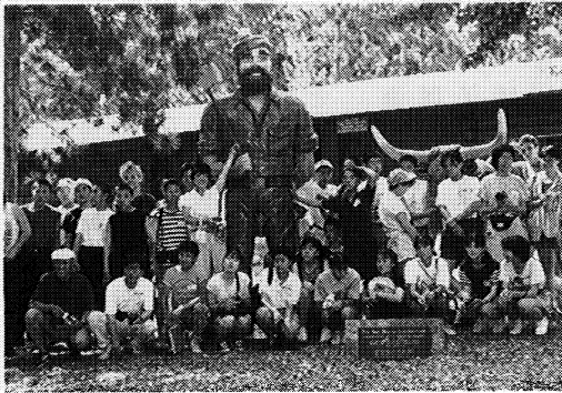
三春町中・高校生によるアメリカ・サマーキャンプ