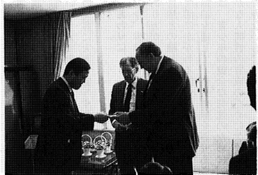
大内県教育長(左)を米国の関係者が表敬訪問

平成元年度には、三春町内の中学生高校生三十名によるアメリカ・サマーキャンプが七月から八月にかけての二十日間にわたって行われた。キャンプの目的は語学研修と文化交流使節の二点である。前半の午前中は大学での語学研修と社会科学を中心にした授業。午後は、午前の学習を生かすための現場での語学学習というプログラムであった。後半では、覚えた知識を活用するために、姉妹都市であるライスレイク市でのホームステイや首都ワシントン訪問などを行った。生徒達は大人の心配をよそに、言葉の障壁を乗り越え、身振り手振りを交えながらもコミュニケーションをうまく取り、異文化をよく吸収すると共に、文化使節の役割を十分に果たしてくれた。 平成二年度には、六月に米国から十一名の教師が来町し、教育講演会や学校訪問を通じ、教育の様々な分野にわ