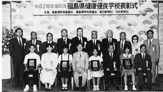
健康づくりをたたえた健康優良学校表彰式