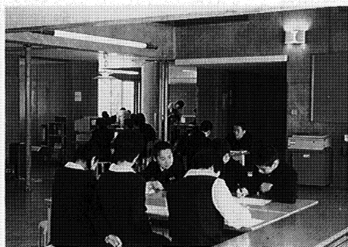
チーム・ティーチングによる数学の授業