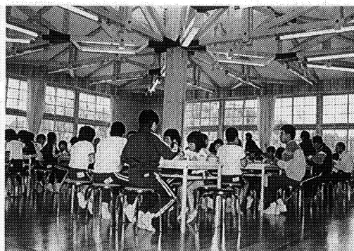
みんないっしょに食堂で楽しい給食

道徳教育・滝根町立滝根小・中学校 教育課程・須賀川市立第三中学校 心身障害児理解・郡山市立片平中学校