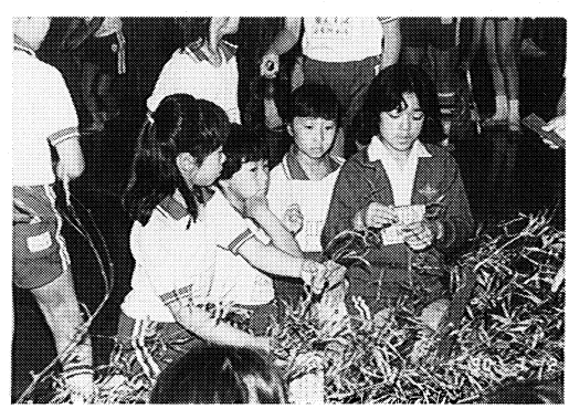
七夕飾りに取り組む「かおりのきょうだい」