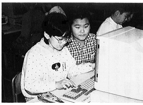
真剣にコンピュータを操作する児童たち

本校には、二十三台のコンピュータが設置されています。少しずつソフトの開発や整備も進み、算数のドリル学習や社会、理科のシミュレーション、CAI学習等に活用されています。また、子どもたちがコンピュータ