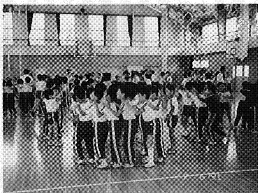
▶お互いに協力し合って

さらに、きょうだい学級や縦割り集会を設定し、人間関係を深めながら共に伸びる子どもの育成に努めているところからです。