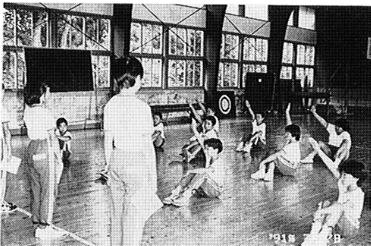
▲よかったところを発表してください

学校では、全校会食後のスピーチ、音読朗読活動、木曜日に全校活動等児童が主役になる場を多く作って、表現力を高めるよう努めています。