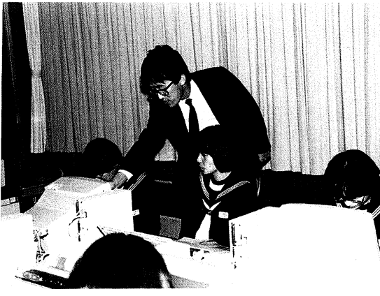
▲ 熱心に活動する生徒

平成元年7月に、21台のパソコンがネットワーク方式により設置され、数学・理科・技術等の教科学習を中心に活用しています。授業の中では、2人1組で使用していますが、生徒たちは興味をもって意欲的に取り組んでいます。昨年度からはパソコン部も新設され、毎日熱心に活動し、高度な知識と技能を身につけている者が増えています。