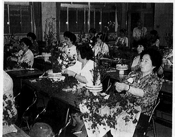
▲ 真剣なまなざしで生け花に取り組む 白河女子高等学校会場