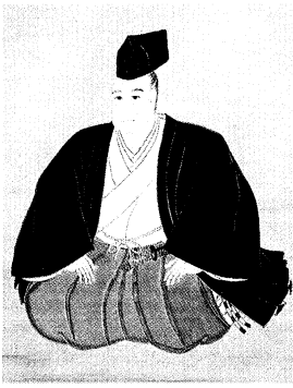
松平定信公自画像

この公園のなかに松平定信公を祭った南湖神社があります。この神社の境内を上っていくと木立ちのなかに南湖神社宝物館があります。この宝物館は昭和五十八年五月に完成したものです。収蔵されている宝物は松平定信公に関するものをはじめ、明治、大正、昭和の三代にわたり各界に活躍した渡沢栄一から奉納された国宝級の絵画（下村観山の楓、橋本永邦の桜など四十七点が展示されています）。