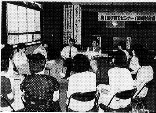
▶平成三年度「子育てセミナー」南郷村会場におけるグループ討議

科学技術の進展や情報化、国際化など、社会の変化に対応して新たな知識や技術の習得を目指す人々が増加し、本県においても学校、地域、職場等、社会の各分野で生涯学習に取り組むための推進体制の整備や、学習機会の拡充などが求められています。 このような、生涯の各時期に応じた県民一人ひとりの学習活動を積極的に援助していくため、県では各種の事業を実施していますが、平成四年度に計画されている主な事業について紹介しましょう。