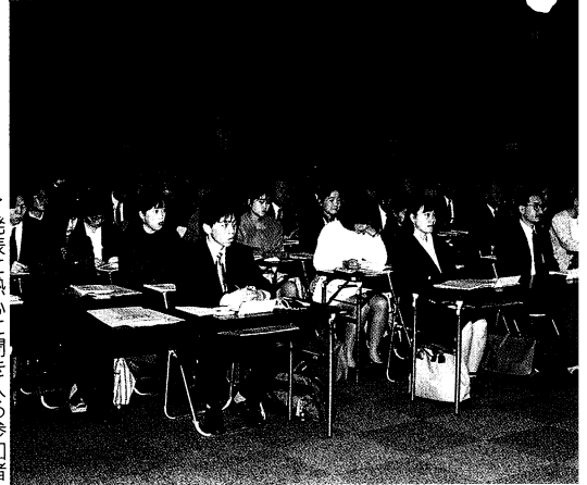
発表に熱心に聞き入る参加者