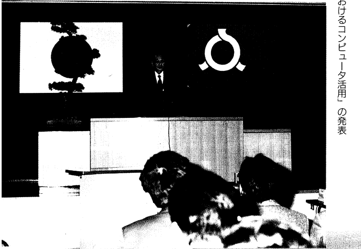
▲開会式であいさつする福島所長 ▶研究の成果を発表する研修者