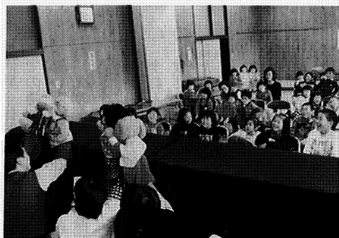
人形劇を楽しむ子供たち

図書の実と誰もが気軽に利用できる図書室をめざして、活動をしています。毎月の行事としては、うぐいす号による企業・中学校・分館での図書の貸出し。そして、幼児・小学生を対象とした「おたのしみ会」では、読みかかせを中心に紙芝居や紙工作等々をしています。子供達には自由な雰囲気の中での活動なので楽しそうです。又、女性を対象とし