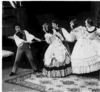
青少年芸術劇場・須賀川

こども芸術劇場は、八月四日に二本松市文化センターで行われ、二期会オペラ振興会が上演する音