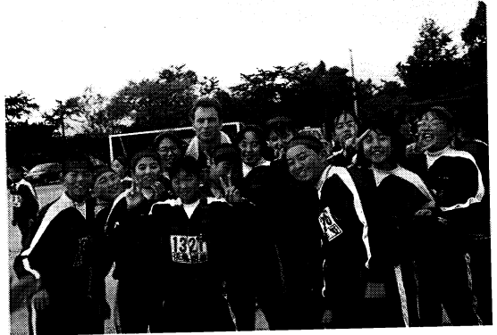
文化祭の運動会でのコマ

また授業の合間には、日本語の勉強に余念がなく、最近では難しい日本語の表現をして職員室の先生方を驚かせています。