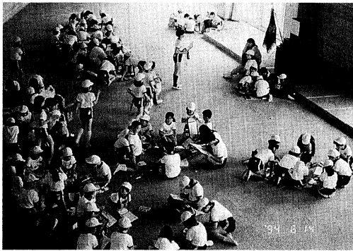
ワークセンターでの学習活動

このワークセンターは校舎の中心というだけでなく、学校行事をはじめ、種々の活動に積極的に活用し、学習活動の中心的スペースでもあります。目の愛護教室や交通教室では、暗幕装置を使い、大きな視聴覚室として活用しました。また、創意の時間の総合的な教育活動「自然教室」では、話し合いに、作業に、発表に利用しました。生活科でも、子供