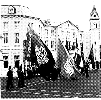
東京六大学応援台戦風景

また、富岡町は「夜の森公園の桜」など、年間を通して温暖な気候、「海・山」の自然に恵まれ、合宿施設周辺には、真近に富岡漁港・海水浴場そして景勝の地として知られる「子安(こやす)観音」があり、松林に囲まれた合宿センターへの道は、合