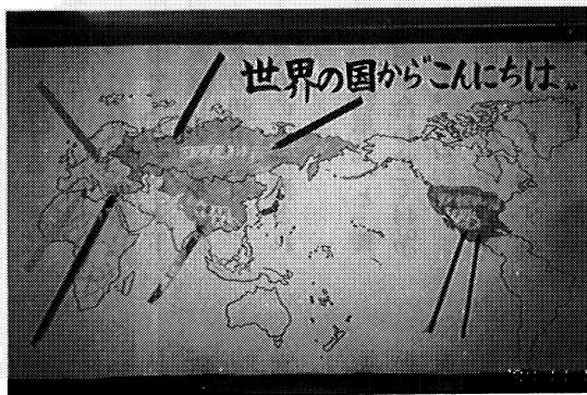
六カ国のことばであいさつゲーム

六月より、外国人子女の日本語指導のための教員の加配があり、外国人子女指導の充実が図られました。加配の趣旨を生かして、日本語習得状況に応じた初・中級別の小グループによる、介在語を使わないことを方針とした日本語適応教室と、通常学級でのT・Tによる指導で、週二十二時間の実践を重ねました。年度末には、個人差はあるものの日常会話が一応成立するまでになり、楽しく生活しています。特に、本校二年目の子女は、学習用語も理解できるようになり、通常授業に意欲的に参加し、学校生活全般にリーダーシップを発揮している