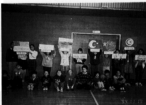
国旗の下に集まった六カ国の友だち

十一月の松長タイム(児童会活動)で集委員会が計画、実施した「世界の国から、こんにちは」では、外国人子女と集委員会が作成した六カ