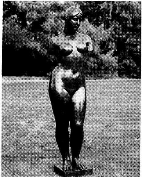
「ヴィーナス（腕のない）」1922年

〈観覧料〉一般・大学生＝820円（660円） 高 校 生＝610円（460円） 小・中学生＝410円（300円） （ ）内は20名以上の団体料金