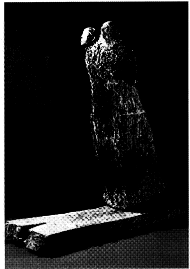
北郷 悟 「生命の川 ～Wind」 1993年