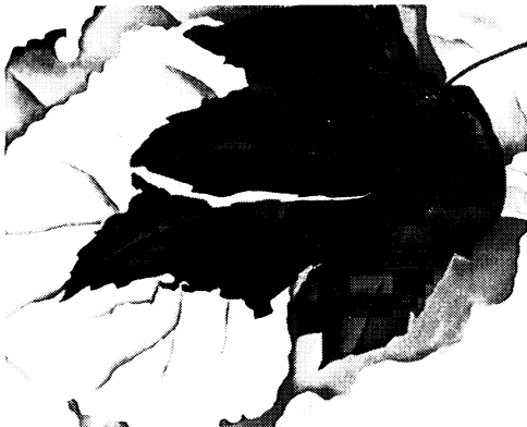
ジョージア・オキーフ「葉のかたち」1923年頃