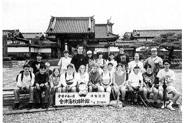
カナダ・南オカナガンの教師・生徒たちとともに