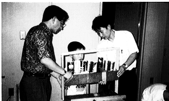
親と子の美術教室「音の出るかたちを見つけよう」 親と子の美術教室では、空カンや木を使ってオリジナルの楽器を作りました。