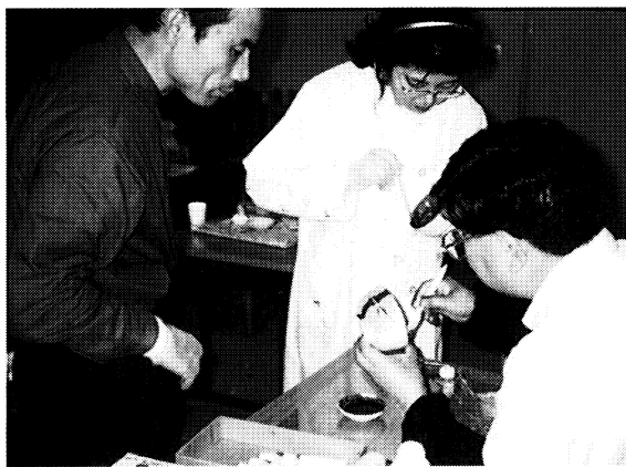
実技講座「漆によるモダン・デザイン」 漆の金属焼き付けや、拭き漆の技法で、愛用のライターや食卓を飾るお椀の装飾を体験しました。