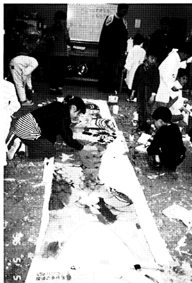
わんぱくミュージアム 「アートな“こいのぼり”」 小学生を対象とした〈わんぱくミュージアム〉では、子供の日には、大きな布に色とりどりの絵具を塗って鯉のぼりを作り、エントランスホールに飾りました。