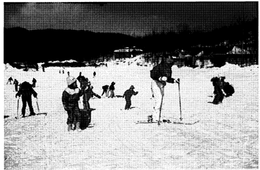
冬のねころんほ広場

施設内には、大人から子供まで楽しめるハラハラ・ドキドキの遊戯施設があります。静寂な樹木の中にあ