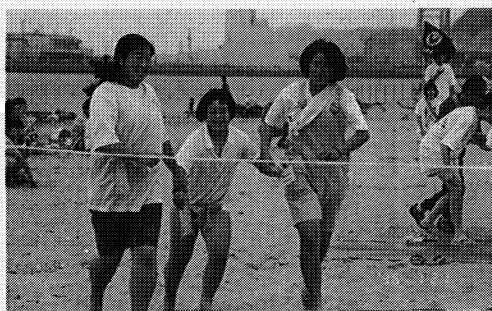
向陽中と県立大笹生養護学校とのふれあい活動

管内の各教育委員会、各幼稚園・各学校では新しい教育の創造に向けてさまざまな取り組みをしています。それらの中で、T・T方式の授業を推進している原町市教育委員会の事業と特色ある教育活動を推進している園や学校を紹介します。