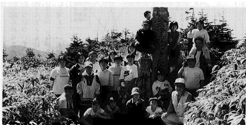
9/28 会津駒ヶ岳登山 （素晴らしい眺めに感動）

きました。子供たちの感想にも次年度への期待がうかがえました。当教育委員会としては、今後、平成九年度についてはもちろん、将来も、子供たちの人間形成に寄与できるような事業を積極的に展開していく所存です。