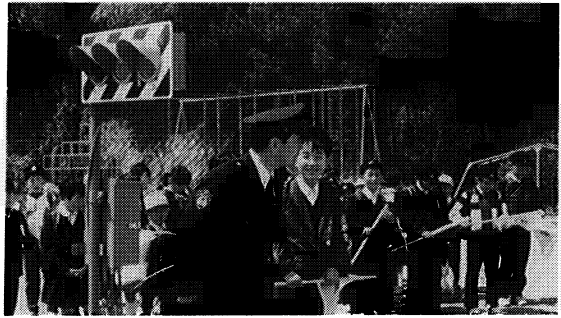
東和町立木幡第一小学校

〒960 福島市杉妻町 5 番75号 TEL (0245)21-7723(代) FAX (0245)21-7996