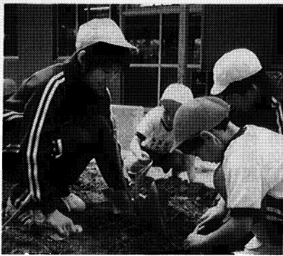
(球根を傷つけないでね)

本校は、平成八年度から文部省と町教委の研究指定を受け、道徳教育を中心にすえて、教育課程を総合的に見直し、子供が生き生きと活躍する学校の実現を目指してきました。様々な体験を意図的・計画的に構成し、内面に根ざした道徳性を育み、日常生活における具体的な実践に結