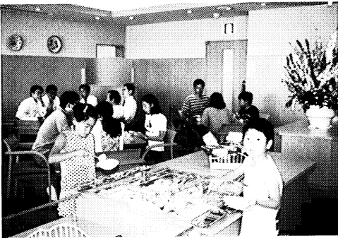
どなたでも利用できるレストラン

この夏、Jヴィレッジは、アジアで初めてのサツカー・ナショナルトレーニングセンターとして、全国大会や日本代表チームの強化合宿、日独少年交流などが開催されました。日本サツカー界の新しい本拠地となるとともに、十一面の天然芝グラウンドと二六〇人収容のホテルは、連日、子供たちをはじめとした一般のサツカー愛好者のイキイキとした表情と歓声に包まれました。また、一六〇人収容の階段教室では、指導者や審判の資格研修が行われるなど、Jヴィレッジは、人材育成の場ともなっています。