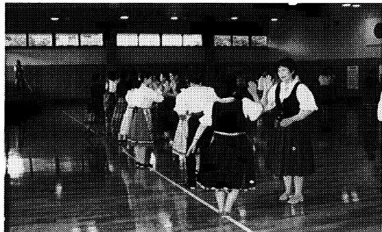
昨年の「あいづ大会」から(フォークダンス)

だれでも気軽に参加できるイベントです。スポーツ・レクリエーション活動を通して、友達の輪を広げてみませんか。