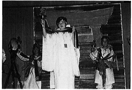
柳津町立久保田小学校児童による古典舞踊「高尾峯」