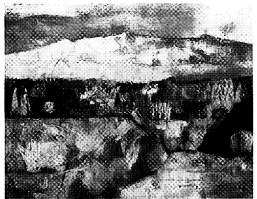
「雪の安達太良山」 吉井 忠 1960年