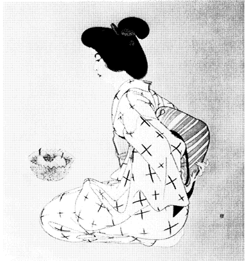
「女二題 其一」 速水御身 1931年