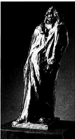
「バルザックの最終習作」 ブロンズ 1907年