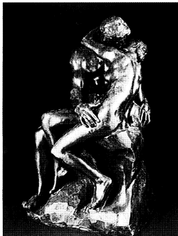
「接吻」 フロンズ 1882年頃