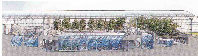
自然環境再現型の施設

施設では、自然の環境を再現した森林の様子やテーマである潮目を再現した大水槽から福島海を学習できます。