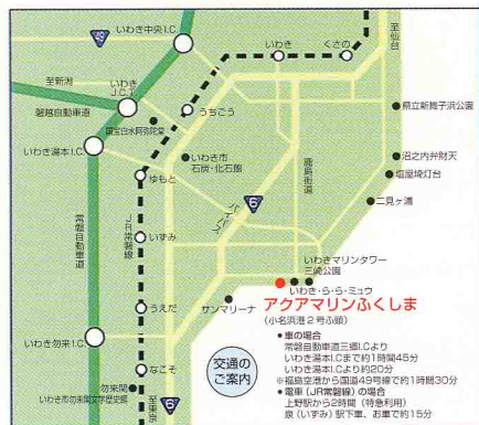
アクアマリンふくしまの位置

施設では、自然の環境を再現した森林の様子やテーマである潮目を再現した大水槽から福島海を学習できます。