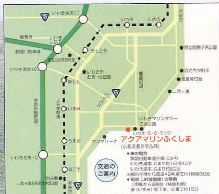
アクアマリンふくしまの位置

「海・生命の進化」コーナーでは、地球上に生命が誕生してからさまざまな進化を遂げるまでの歴史を化石と生きた化石を展示することにより演出します。