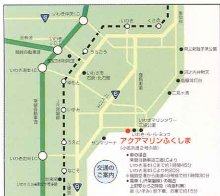
アクアマリンふくしまの位置

次回は、福島県の自然を再現する「ふくしまの川と沿岸」、サンマを展示する「ふくしまの海」をご紹介します。お楽しみに!