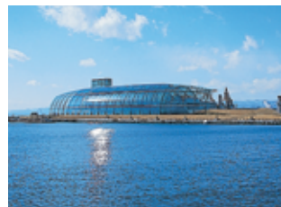
アクアマリンふくしま (ふくしま海洋科学館)