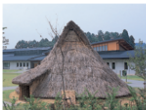
まほろん(県文化財センター白河館)

あぶくま 阿武隈川の源流がある県南地域は、東北の玄関口として古くから栄え、たくさんの文化財があります。また、工場の進出もさかんです。