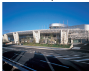
ビッグパレットふくしま