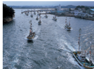
松川浦漁港の漁船団